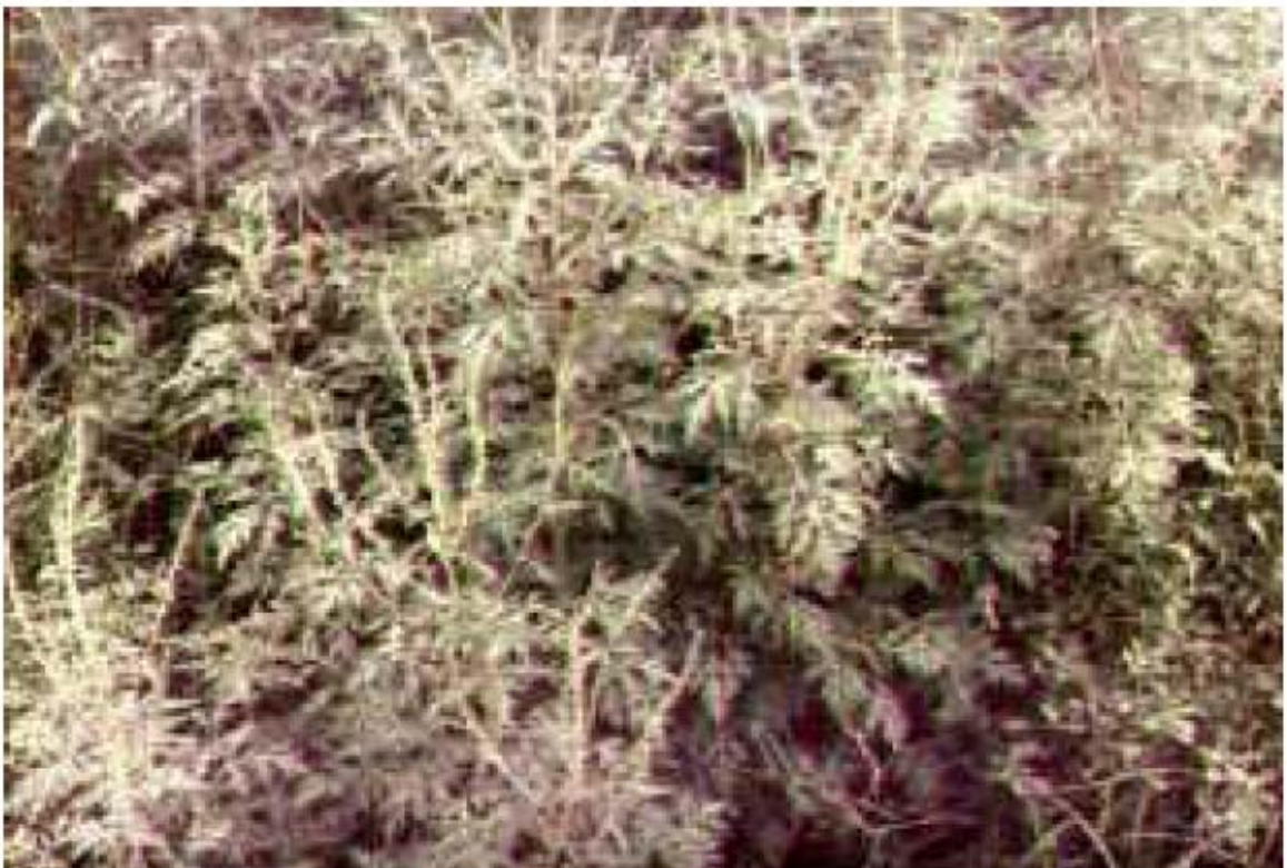
Ambrosia peruviana Willd (altamisa, marco, artemisia, ajeno del campo).

Pertenece a la tribu heliantheas, planta herbácea perenne, cosmopolita. Es indígena de Perú. Sus hojas son verdes por el haz y blanquecinas por el envés, de forma palmatisecta y palmatinervada de bordes dentados; el tallo termina en una larga espiga de numerosas cabezuelas, de color amarillento cremoso. Florece en verano.