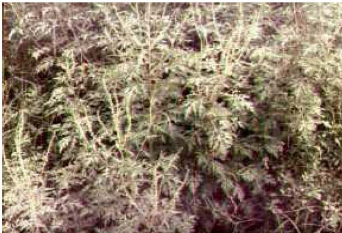
Ambrosia peruviana Willd (altamisa, marco, artemisia, ajeno del campo).

Pertenece a la tribu heliantheas, planta herbácea perenne, cosmopolita. Es indígena de Perú. Sus hojas son verdes por el haz y blanquecinas por el envés, de forma palmatisecta y palmatinervada de bordes dentados; el tallo termina en una larga espiga de numerosas cabezuelas, de color amarillento cremoso. Florece en verano.